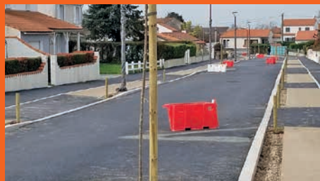
Rue encore en travaux... reste des plantations et la signalisation horizontale et verticale à réaliser

Datant du début des années 70, la rue des Garennes s'est transformée en une jolie rue de bourg. Désormais, cette voie est devenue une zone limitée à 30 km/heure, pour une circulation apaisée faisant la part belle aux circulations piétonnes et cyclistes.