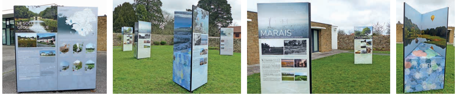
Exposition "Paysages perçus"

1. Une dimension subjective qui est la perception que chacun a d'un territoire et elle est aussi collective en révélant les différentes