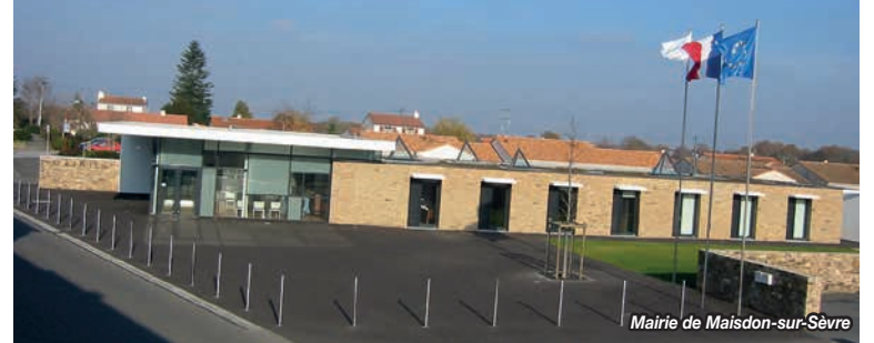
Mairie de Maisdon-sur-Sèvre

sur le métier avec les réserves foncières constituées :